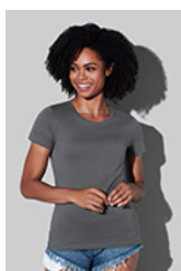
ST2620 Classic-T Organic