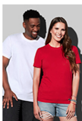
ST2020 Classic-T Organic