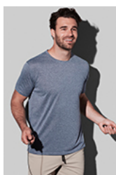
ST8830 Recycled Sports-T Move