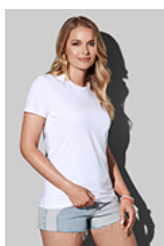
ST2160 Comfort-T 185